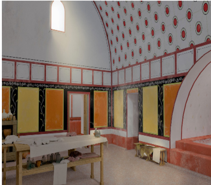
3D visualisatie van het badhuis

“Doe niet zo stom,” antwoordde Linus. “De badbaas is een vriend van mijn vader!”